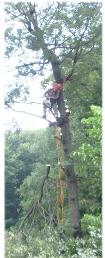
川越高等技術専門校木工科生徒と行ったヤマの見学会（伐採見学）