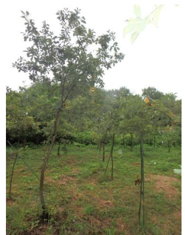
若返りを図るため伐採(H29.3) 更新した平地林の現況 (撮影R2.10)

さんとめねっと(三富地域農業振興協議会)でも、ナラ枯れは、三富地域の農業、平地林に大きな影響を与えるため、埼玉県、区域の市町等と協力し、被害の防止、防除及び、平地林の再生について皆様と共に考えていきたいと思ひます。