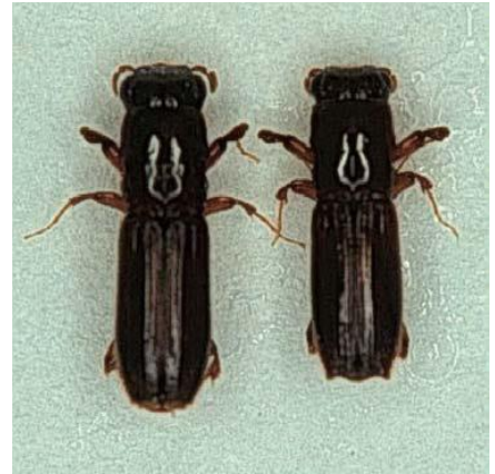
カシノナガキクイムシ メス成虫とオス成虫

伐採されず、高齢化・大径木化した平地林のコナラやクヌギはカシノナガキクイムシにとって繁殖しやすい状況となり、被害が拡大しているといわれています。